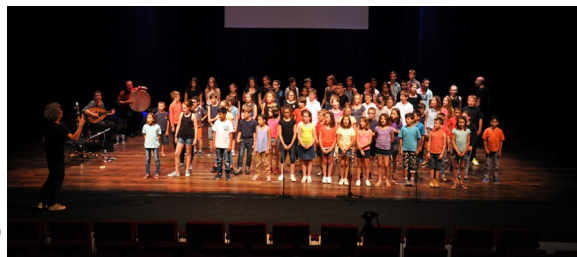
Bab Assalam, 2017